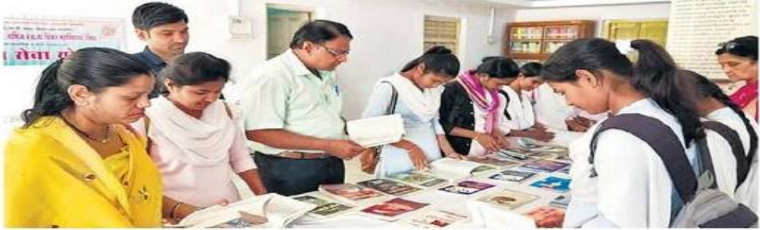
बुटले महाविद्यालयात ग्रंथप्रदर्शनातील पुस्तके न्याहाळताना मान्यवर व विद्यार्थी.

inoh o inO;qRrj ejkBh foHkkx 2019 & 2020 ejkBh Hkk''kk xkSjo fnukfufeR; cqVys egkfo|ky;kr xzaFkizn'kZuhps vk;kstu-